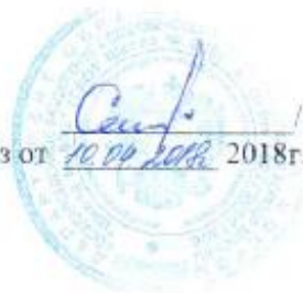
График организации дистанционного обучения с использованием ресурсов МЭШ в 2018-2019 учебном году

06.10.2018 – по расписанию на понедельник 17.11.2018 – по расписанию на вторник 29.12.2018 – по расписанию на среду 16.02.2019 – по расписанию на четверг 06.04.2019 – по расписанию на пятницу.